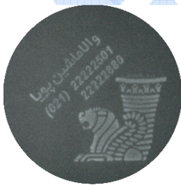
( هم رنگ فلز )

دستگاه مذکور از 5 سال گارانتی و 10 سال خدمات پس از فروش برخوردار می باشد .