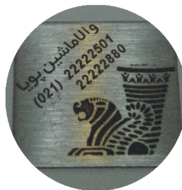
( سیاه روی فلز )